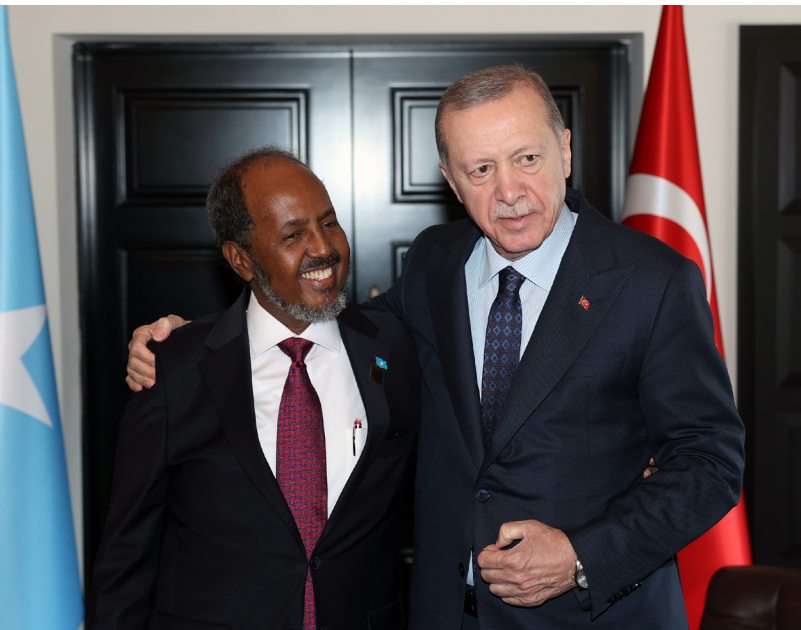
Le président turc Recep Tayyip Erdogan rencontre le président somalien Hassan Sheikh Mohamud dans le cadre du Forum diplomatique d'Antalya (ADF) à Antalya, en Turquie, le 2 mars 2024.

dans la guerre civile au Soudan fait avancer ses objectifs géopolitiques, mais n'est pas sans risque], le rôle de Téhéran dans le financement et l'armement de proxies au Moyen-Orient a suscité plus d'intérêt depuis l'attaque du Hamas contre Israël le 7 octobre 2023, alors que son intervention militaire au Soudan n'a reçu que peu d'attention. Entre décembre 2023 et janvier 2024, l'Iran a fourni plusieurs drones de reconnaissance et de combat de moyenne portée Mohajer-6 au président Abdel Fattah al Bourhane et aux Forces armées du Soudan (SAF, selon l'acronyme en anglais), ce qui montre clairement que l'Iran utilise de plus en plus son implication dans les zones de conflit africaines pour servir ses ambitions militaires, commerciales et, surtout, géopolitiques. Armer les SAF contribue à la fois aux objectifs géopolitiques plus larges de l'Iran et à sa concurrence avec des rivaux régionaux tels que l'Arabie saoudite, les EAU et Israël. Téhéran s'est également impliqué en Éthiopie lors de la guerre du Tigré en 2020-2022.