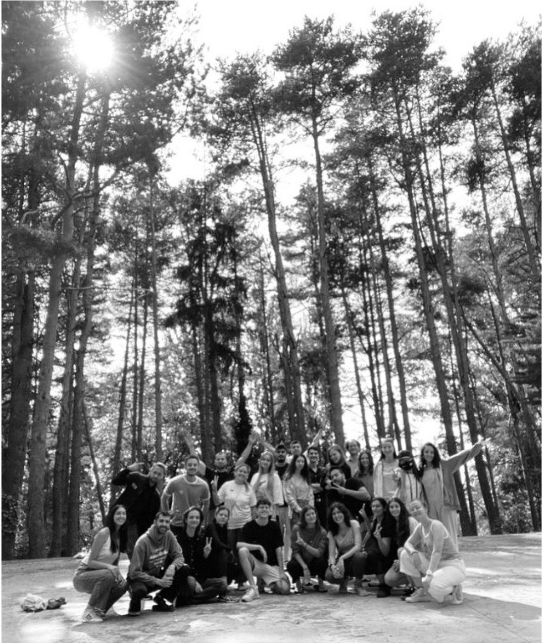
Members of the Asociación Juvenil Talasa.