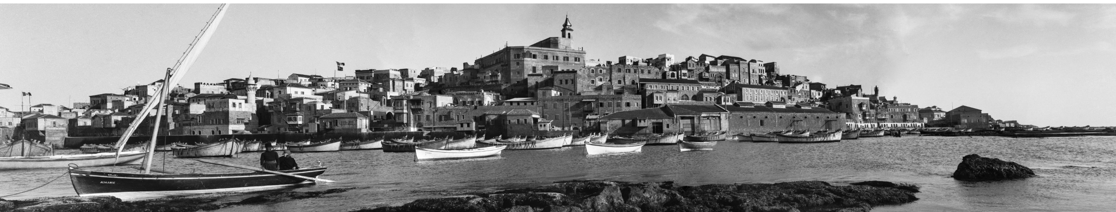
Puerto de Jaffa. 1926

las de la costa y las comunidades musulmanas y cristianas más que las judías. Les interesan especialmente las trazas materiales y culturales del pasado bíblico, a la vez que dejan fuera del foco las manifestaciones de la modernidad, la lucha anticolonial o los conflictos que suscita la creciente emigración judía. La importancia de esta colección fotográfica , única en nuestro país, radica en ofrecer un testimonio de excepción sobre las sociedades del Próximo Oriente , en particular la de la Palestina de las décadas anteriores a la proclamación del estado de Israel. Unos tiempos en que los efectos de la modernidad apenas empezaban a hacerse notar y a alterar unas formas de vida tradicionales que, a los ojos de quienes entonces las contemplaban, parecían no haber variado sustancialmente desde los tiempos bíblicos.