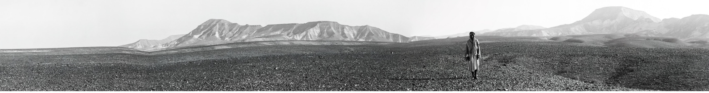
Desierto y montañas de la frontera meridional de Palestina, 1925-1927