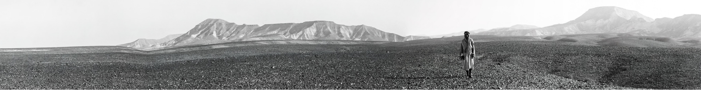
Desert i muntanyes de la frontera meridional de Palestina, 1925-1927