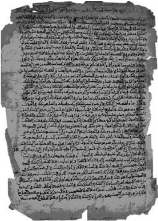
Manuscrit du témoignage d'al-Wartilani à Tlemcen.