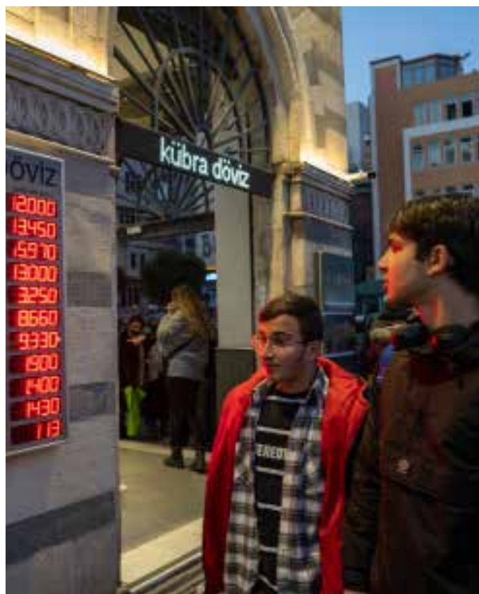
Bureau de change à Istanbul, décembre 2021.

La crise financière mondiale de 2008 a ouvert une fenêtre d'opportunité pour la Turquie, ainsi que pour d'autres pays en développement. La foi orthodoxe dans la primauté des marchés a été ébranlée par la crise. La montée en puissance des pays non occidentaux – la Chine en tête – et les stratégies de développement alternatives menées par l'État ont été davantage reconnues par les pays en développement. Plusieurs d'entre-eux ont eu l'occasion d'expérimenter différentes idées de progrès, qui transcendent le modèle néolibéral. L'élite dirigeante turque a aussi adhéré à ces idées, du moins à certains égards. Par exemple, en 2011, le gouvernement a adopté un document de stratégie industrielle, ainsi que de vastes programmes d'incitation à l'investissement pour stimu-