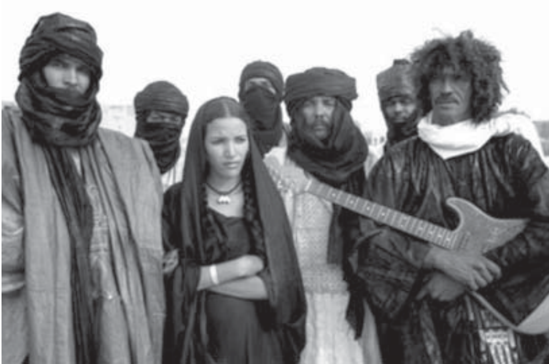
Imagen del grupo musical Tinariwen, de Eric Mulet.

dicación surgidos de los diversos campamentos de refugiados que tienen eco en el resto de las comunidades.