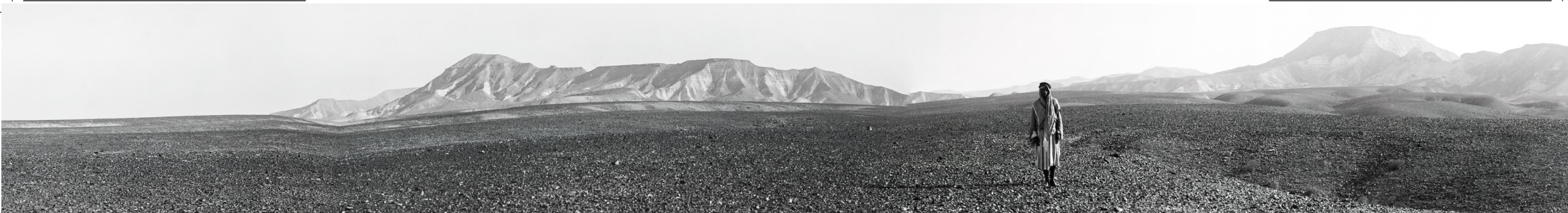
Desert i muntanyes de la frontera meridional de Palestina, 1925-1927