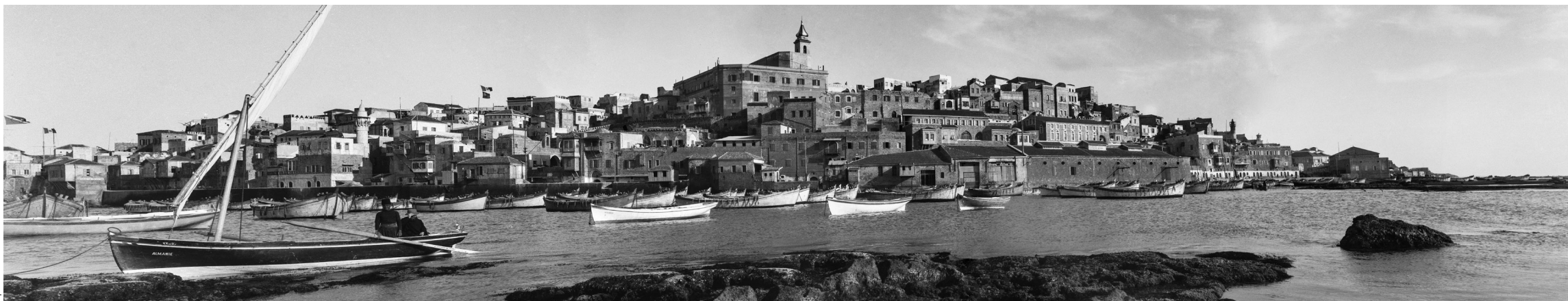
Puerto de Jaffa. 1926

rural que el urbano, las tierras del interior que las de la costa y las comunidades musulmanas y cristianas más que las judías. Les interesan especialmente las trazas materiales y culturales del pasado bíblico, a la vez que dejan fuera del foco las manifestaciones de la modernidad, la lucha anticolonial o los conflictos que suscita la creciente emigración judía. La importancia de esta colección fotográfica, única en nuestro país, radica en ofrecer un testimonio de excepción sobre las sociedades del Próximo Oriente, en particular la de la Palestina de las décadas anteriores a la proclamación del estado de Israel. Unos tiempos en que los efectos de la modernidad apenas empezaban a hacerse notar y a alterar unas formas de vida tradicionales que, a los ojos de quienes entonces las contemplaban, parecían no haber variado sustancialmente desde los tiempos bíblicos.