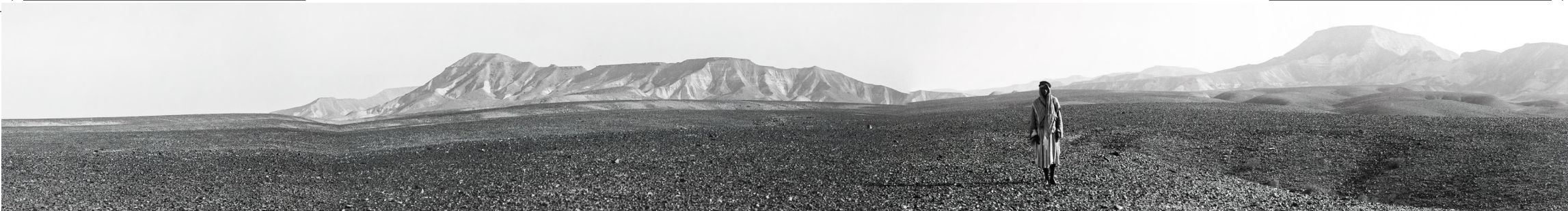
Desierto y montañas de la frontera meridional de Palestina, 1925-1927