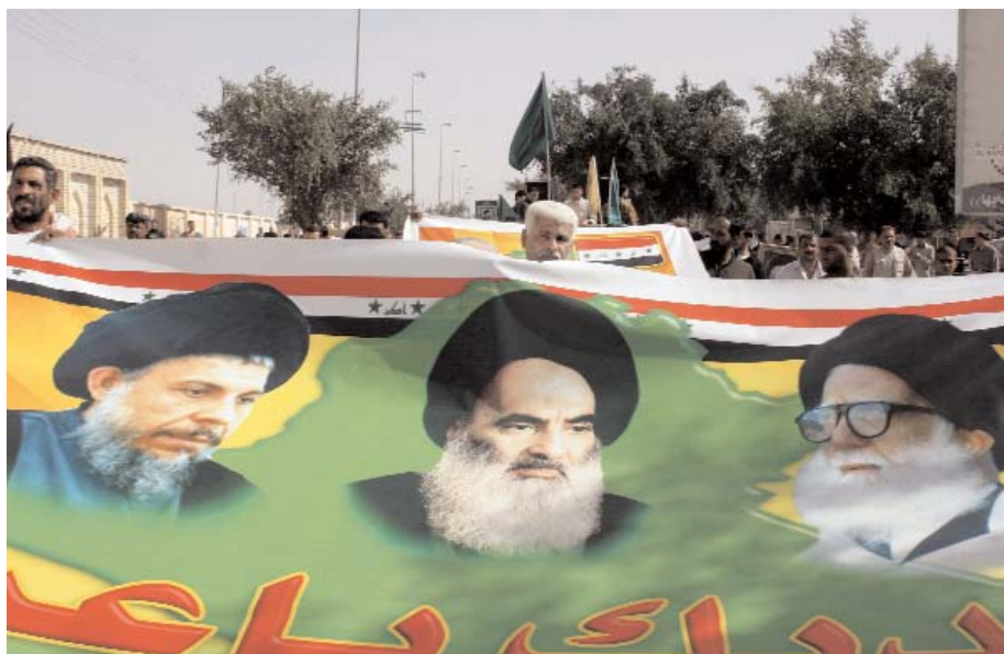
Una pancarta con las imágenes (de izquierda a derecha) del fallecido ayatolá Mohammed Baker Al Sader, del gran ayatolá Ali Al Sistani y del fallecido ayatolá Mohammed Sadeq Al Sader precede a la manifestación en apoyo del primer ministro Ibrahim Al Yafari en la ciudad santa de Nayaf, el 4 de marzo de 2006. Facciones políticas kurdas y suníes rechazaron la candidatura de Yafari, para dirigir el próximo gobierno.

En este sentido, la desaparición de la vida política activa del primer ministro israelí, Ariel Sharón, y el formidable e inesperado triunfo electoral de la organización Hamás, que EE UU e Israel han catalogado como terrorista, más las carencias, véase corrupción, de la Autoridad Nacional Palestina, han abierto una nueva etapa de incertidumbre para Israel y para Oriente Próximo. Los palestinos