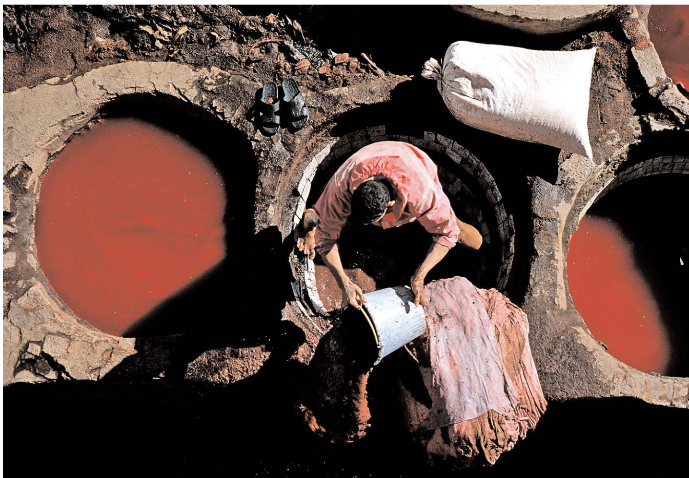
Trabajador de pieles.

y vivieron el djezba o éxtasis como fruto de la unión con Dios que se exprime con la danza.