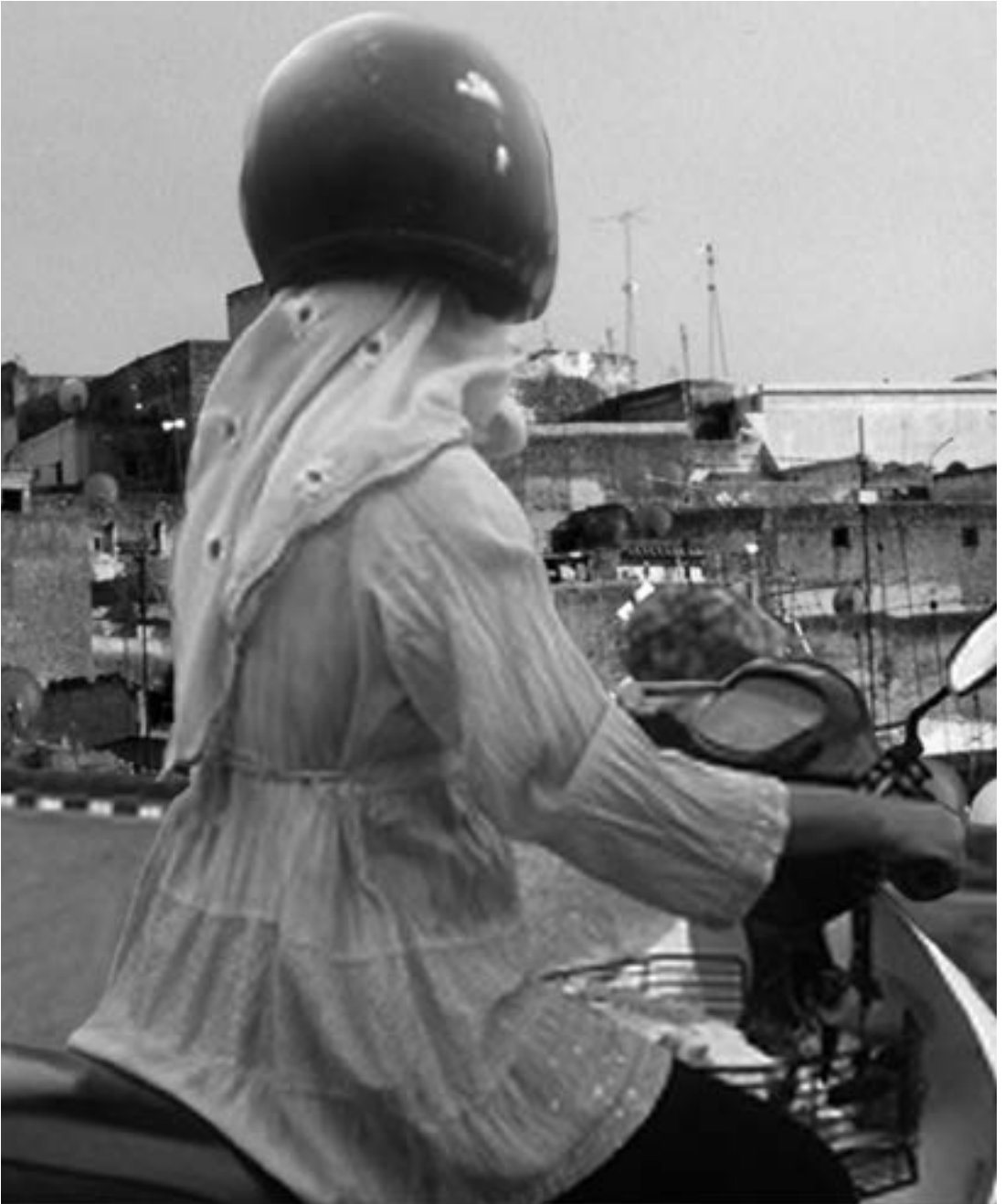
Turkish young women in Istanbul.