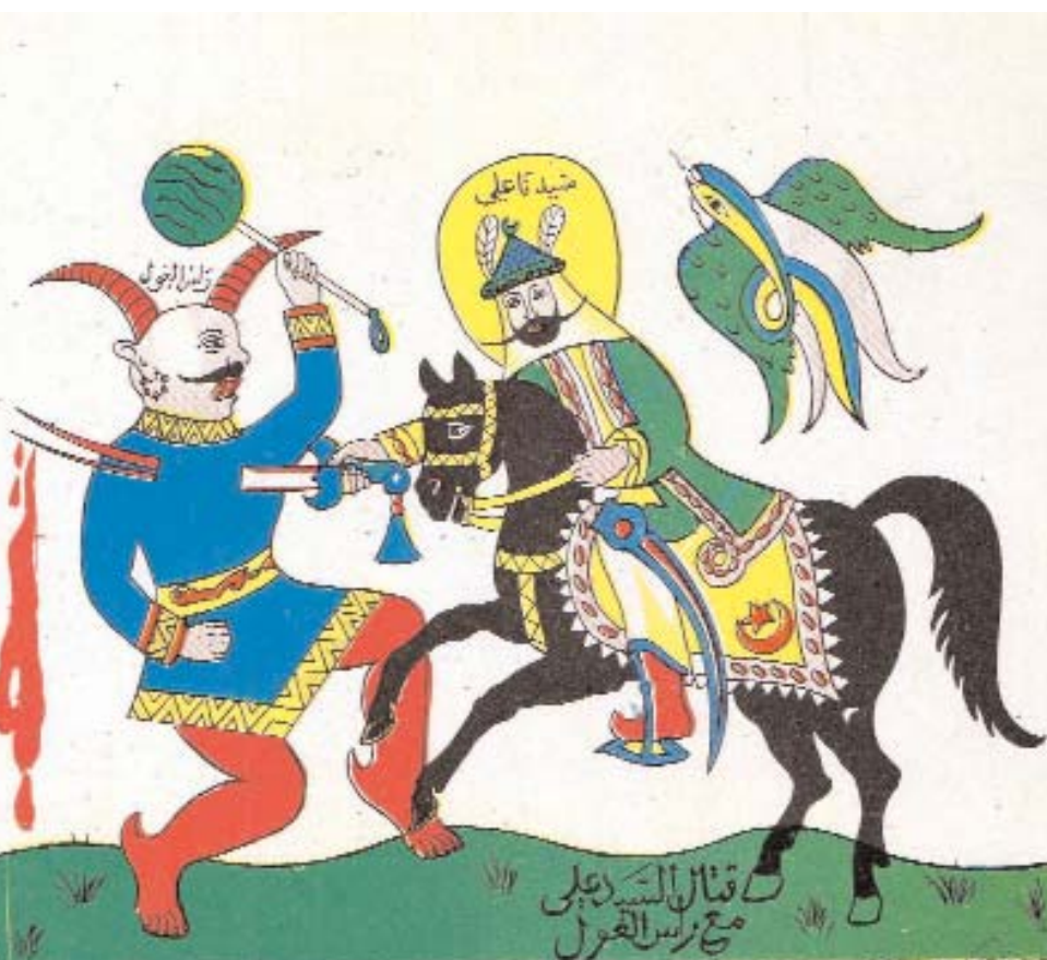
Estampa popular marroquí en la que aparece Ali matando al demonio, Ras el Ghul.

har y la “Casa del Saber”, antes de que el ilustre Saladino la derribara en 1171.