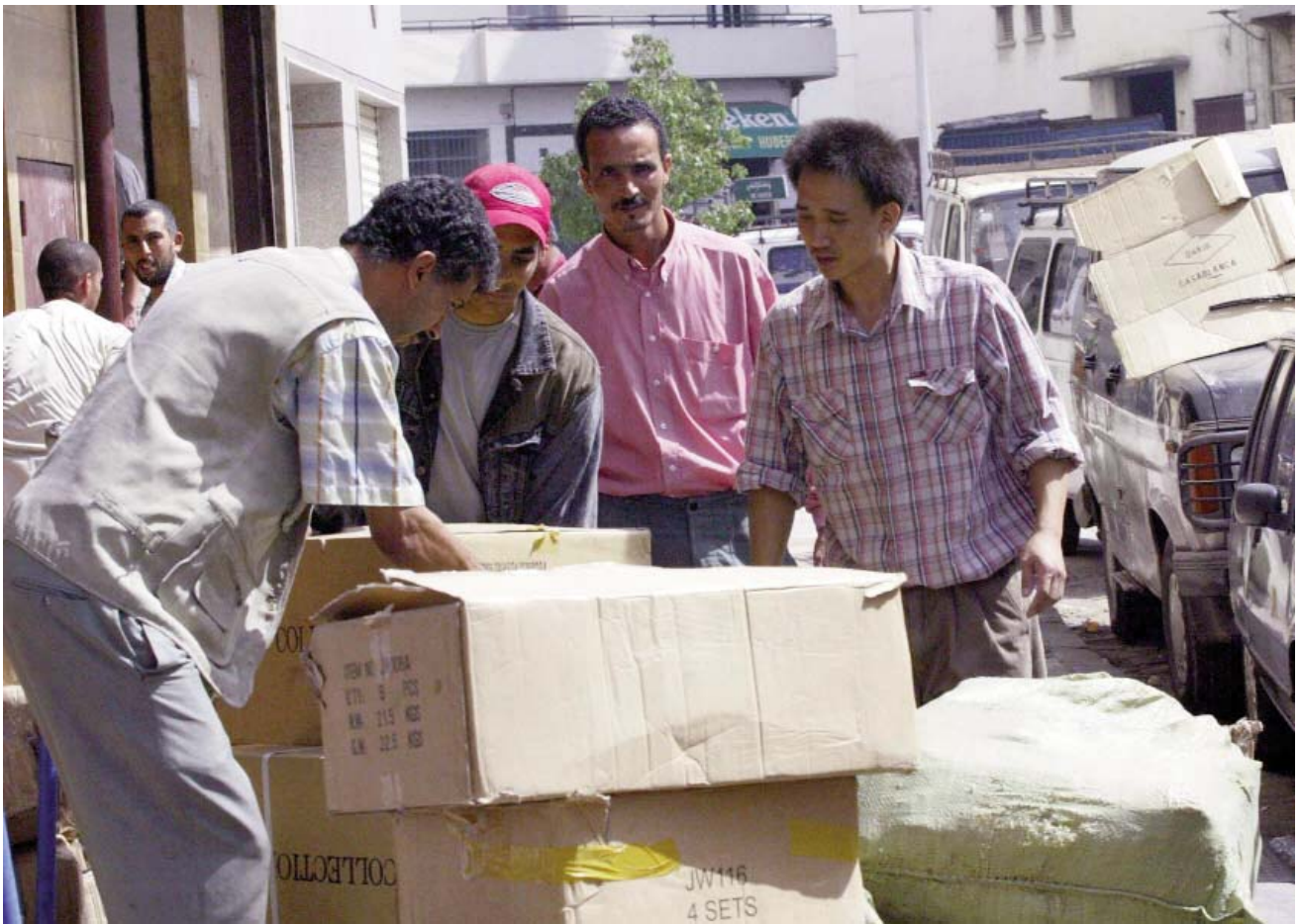
Vendedor chino en Casablanca. Marruecos.

justificada la hipótesis de que sucederá lo mismo en los países del norte de África en los que están presentes los inversores indios. Por tanto, podemos esperar que en el futuro habrá repercusiones más importantes en lo que se refiere a empleo y desarrollo tecnológico.