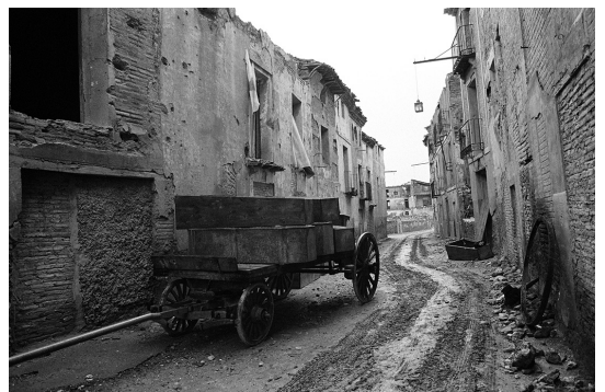
Munchausen in Belchite (Francesc Torres).