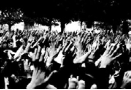
La gestuelle du « Dégage ! », Avenue Habib Bourguiba, Tunis, 14 janvier 2011.

l'offense et au blasphème religieux. Les deux sont vécus comme une transgression. La création artistique, subversive, défie la religion, transgresse les normes, les représentations et les croyances religieuses, alors que les actes de violence et de destruction envers les œuvres et les espaces de diffusion de la création artistique cherchent à faire taire et contraindre la liberté d'expression, de conscience, de création et d'opinion. La bataille des religieux et des séculiers dans l'espace public prend forme dans ce contexte de « concurrences de styles de vie » (Zeghal, 2013). Chacun des partis cherche à définir les normes, les valeurs et les pratiques sociales dominantes qui ordonnent la vie publique et la société.