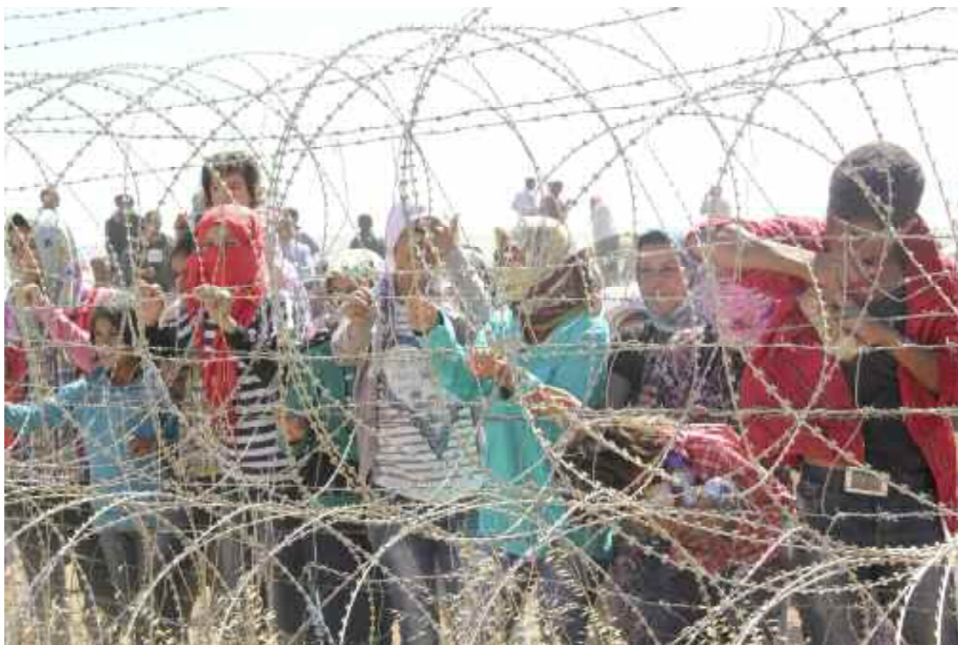
Des Kurdes syriens attendent pour franchir la frontière entre la Syrie et la Turquie, fuyant les combats entre l'État islamique et les forces du Parti de l'Union démocratique. Syrie, septembre 2014.

du pouvoir iranien et de voir la révolution islamique s'exporter. Cet effort a rencontré de nombreuses difficultés en raison de l'attraction que la révolution iranienne exerçait sur les masses arabes en général et sur le mouvement islamiste en particulier, de la populaire attitude anti-israélienne et anti-américaine du gouvernement iranien et du fait que ce dernier n'ait jamais agressé un pays arabe. Une partie de la solution, promue par l'Arabie saoudite, l'Égypte, la Jordanie et de nombreux acteurs sympathisants du salafisme, a été d'attirer l'attention sur la pernicieuse menace que l'expansionnisme chiite supposait pour l'islam sunnite.