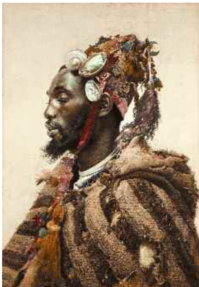
Josep Tapiró. Le marabout. / COLLECTION PRIVÉE. BARCELONE

peintures correspondaient aux positions du réalisme anecdotique en vogue dans toute l'Europe dans le dernier tiers du siècle. De la même façon que certains peignaient le côté le plus ludique et agréable de la vie bourgeoise, Tapiró décrivait l'aspect le plus pittoresque et choquant de la société traditionnelle tangéroise. En général, on peut distinguer deux genres d'œuvres dans sa production : celles qui présentaient des scènes de la vie quotidienne et des cérémonies traditionnelles sur des scènes minutieusement décrites, et les portraits très détaillés de la diversité humaine de la ville. Ces derniers constituent le versant majoritaire de sa production. On remarque les mariées somptueusement vêtues, les hommes populaires, les mendiants, les santons et les portraits des personnalités maghrébines illustres – preuve du prestige dont jouissait le peintre parmi la société autochtone – en bonne partie favorables au rapprochement envers les coutumes occidentales et bien disposées à se laisser peindre. Remarquons aussi que la vie de la colonie occidentale a toujours été exclue de ses pinceaux, bien qu'elle constituait son entourage quotidien le plus immédiat. Du point de vue commercial, son œuvre combinait deux aspects qui la rendaient attrayante sur le