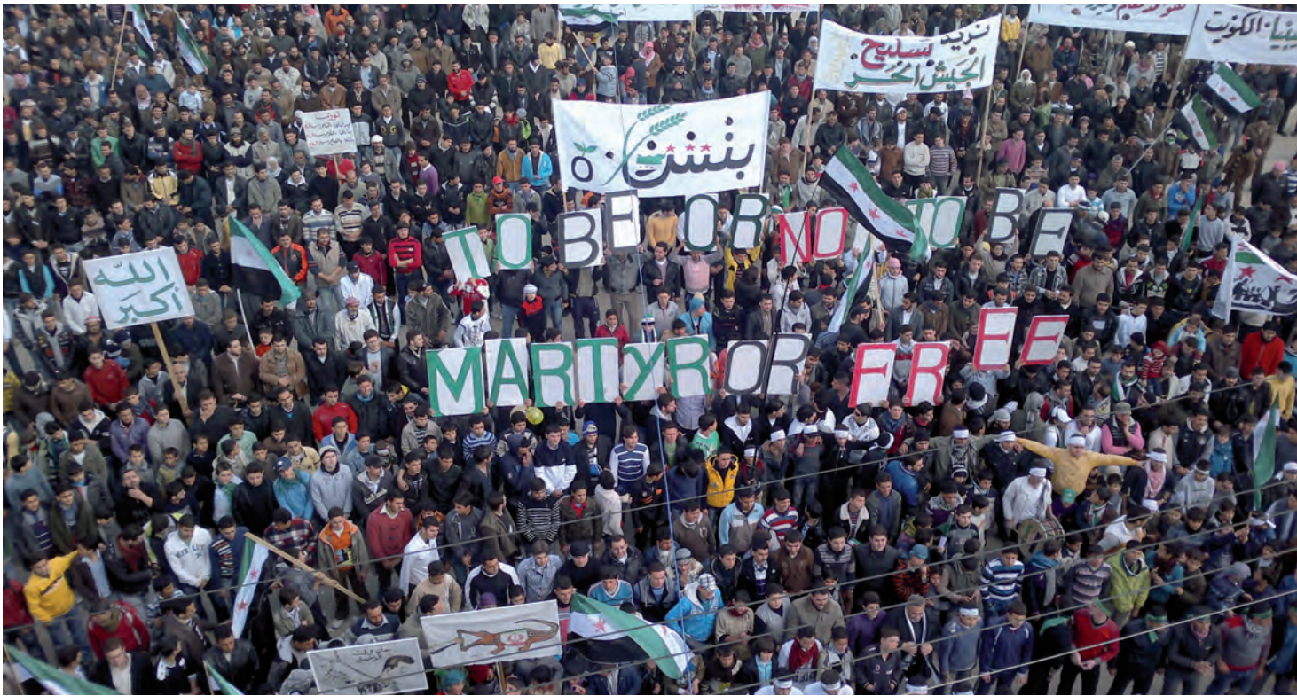
Idlib, 2 mars 2012.

trepreneurs surgit en Syrie à partir des cendres de ce qui avait été une économie centralisée.