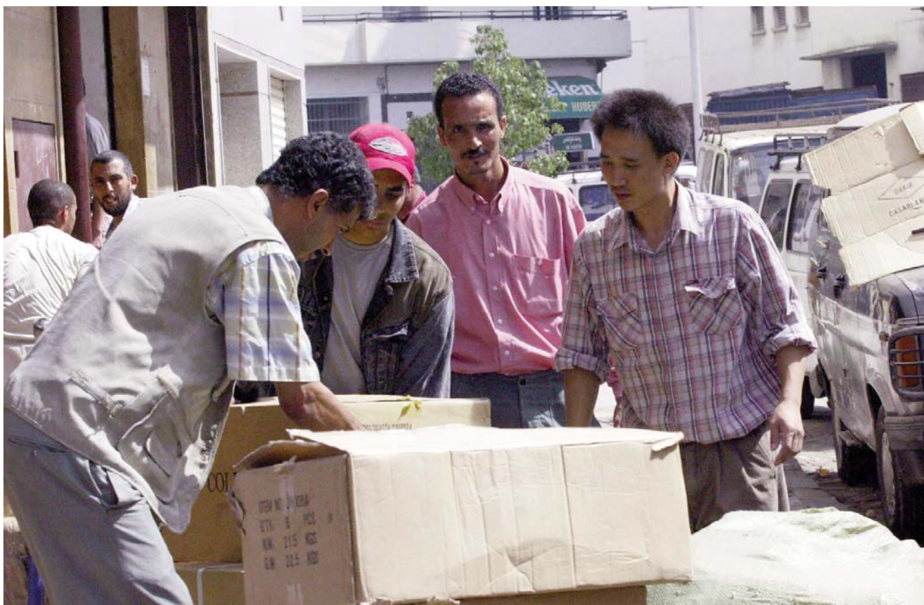
Vendeur chinois à Casablanca. Maroc.

manufacturières et des centres de formation. Il paraît légitime de faire l'hypothèse que ce sera également le cas dans les pays d'Afrique du Nord où les investisseurs indiens sont présents. Dès lors, des effets plus importants en termes d'emplois et de développement technologique peuvent être escomptés à l'avenir.