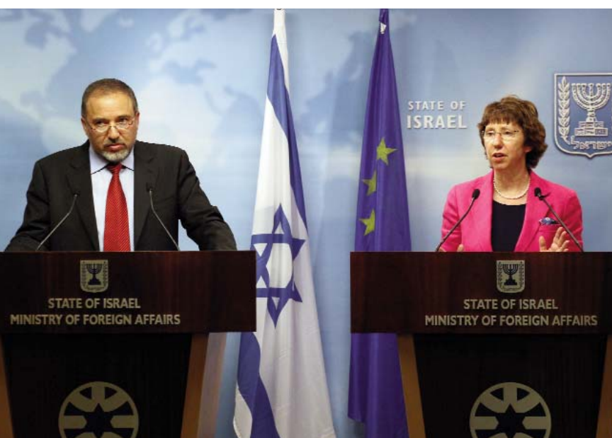
Catherine Ashton, haute représentante de l'UE, et Avigdor Lieberman, ministre israélien des Affaires étrangères, en conférence de presse lors de la visite d'Ashton à Israël. Jérusalem, juillet 2010.

te de l'Europe pour son développement économique et son rôle éventuel de garante de sa sécurité générale. Sept ans de lutte contre le soulèvement palestinien, le cycle d'action et réaction apparemment interminable, la dégénérescence du milieu politique palestinien et l'échec de sa campagne militaire au Liban à l'été 2006 avaient conduit les milieux politiques israéliens à mettre en doute l'utilité de la force militaire pour faire face à ses enjeux en matière de sécurité. Tout ceci s'accompagnait d'une volonté croissante, de la part d'Israël, de collaborer avec l'UE pour trouver la solution à de tels défis. Il y avait toujours des différences avec l'UE sur le processus de paix au Proche-Orient, mais un rapprochement progressif entre les pensées israélienne et européenne s'était néanmoins produit sur les stratégies nécessaires pour mettre fin au conflit palestino-israélien.