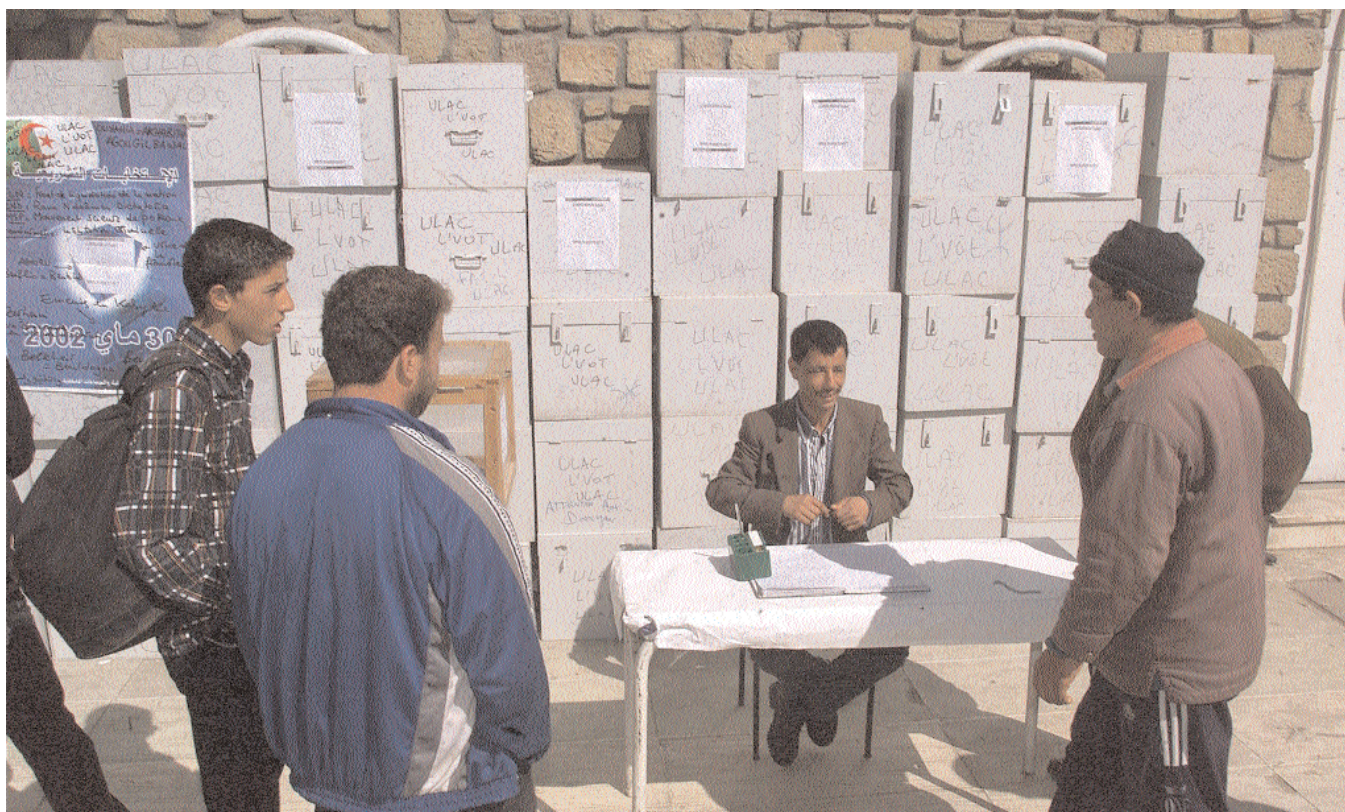
Algérie, élections législatives mai 2002.

Abassi Madani et Ali Belhadj, eût été contraire à la loi sauf les assigner à résidence en vertu de l'état d'urgence. Ce qui n'a été fait pour personne et contre personne depuis fort longtemps. Je ne vois pas en quoi l'application de la loi constituerait une démarche politique de réconciliation nationale.