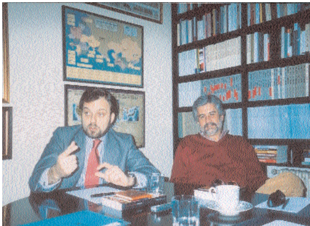
Gustavo Arístegui et Manuel Marín, porte-paroles des Affaires étrangères au Congrès pour le PP et le PSOE, respectivement.

M.M. : Sur ce problème, un accord a été passé entre les deux principaux parti, PP et PSOE. Jusqu'en novembre 2003, les problèmes de l'immigration ont été éminemment politiques, au pire sens du terme. Un accord avait été dressé contre la réalité : le fameux effet d'appel a été utile pour les élections de 2000 ; par la suite, le Plan Greco, sans pratiquement aucune dotation budgétaire. On a laissé les Communautés autonomes et les maires se responsabiliser de l'immigration. En Catalogne, il y a eu des cas significatifs avec la récolte des champs fruitiers, à Lérida, où les problèmes sont croissants... Mieux vaut ne pas se rappeler de ces trois ans de l'ancien secrétaire d'Etat pour l'Immigration : l'une des pires gestions imaginables. A partir de novembre, nous nous sommes mis d'accord : les critères signalés par Gustavo Arístegui sont corrects. L'intérêt de l'Espagne est que l'espace Schengen se développe rapidement, de même que les dispositions liberté / justice, non pas tant pour le problème de l'immigration que pour ce que nous appelons « terrorisme ou sécurité ». Nous avons besoin de politiques migratoires plus actives. Pour le moment, aucun choc n'a été observé entre les espagnols et les immigrés, mais il faut rester vigilant. L'application des modules de logement de protection sociale fait que nombre d'immigrés, en raison de leur salaire ou de leur nombre d'enfants, passent avant les